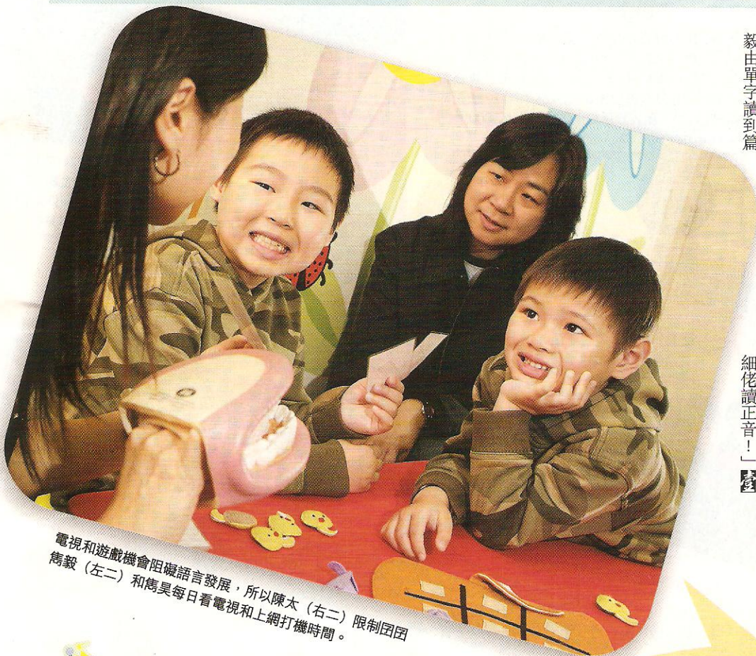
電視和遊戲機會阻礙語言發展，所以陳太(右二)限制囡囡(左二)和雋昊每日看電視和上網打機時間。